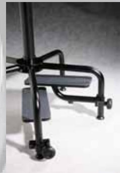
Abb. mit eingeklappten Fußstützen. Standardausführung ohne Fußstützen.

Das speziell konstruierte Fünffußgestell gibt Sicherheit und dient als Aufnahme für die dreidimensional verstellbaren Fußstützen. Solide Ausführung in Stahl, Oberfläche schwarz pulverbeschichtet, Ø 68 cm.